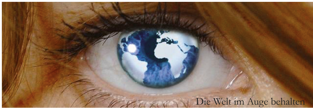
Die Welt im Auge behalten